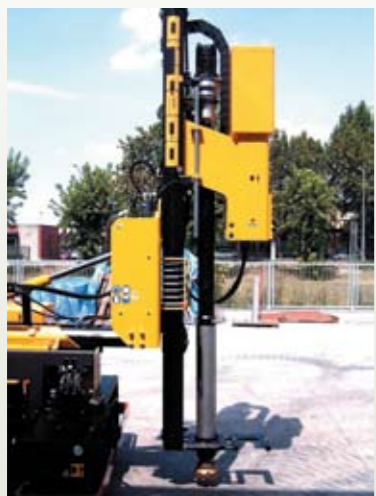
MARTEAU FOND DE TROU